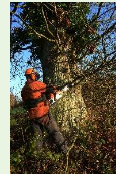
Coupe d'une haie avec matériel adapté