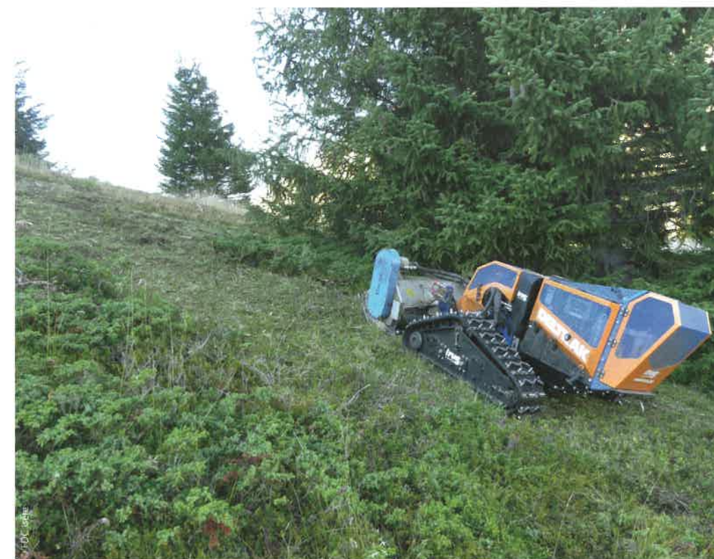
▲ Les travaux d'ouverture du milieu constituent à la fois une amélioration pour l'activité pastorale et une action de restauration d'habitats de reproduction pour les galliformes.

Dès 2008, face à ces constats mitigés, des programmes Agrifaune départementaux ou régionaux en lien avec la thématique « pastoralisme et petite faune de montagne » ont été engagés. Les objectifs visés étaient de répondre aux questions techniques de localisation des enjeux et d'évaluation de l'efficacité des modifications des pratiques pastorales, et d'apaiser les tensions entre les différents acteurs ruraux.