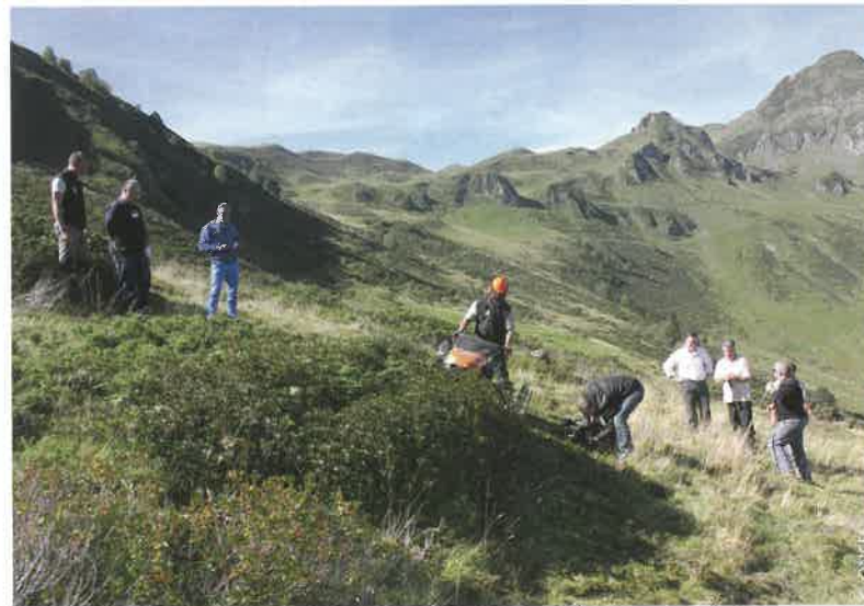
▲ Réouverture de milieu favorable au pastoralisme sur Aulon par broyage mécanique de la lande à rhododendron et genévrier.

Au départ, aucun des acteurs n'avait pour habitude de travailler avec les autres. Le programme Agrifaune a permis d'ouvrir le dialogue, de co-construire une gestion partagée des espaces et de faire évoluer des projets liés à la gestion de l'estive, à des enjeux cynégétiques, environnementaux et touristiques. C'est donc bénéfique pour l'environnement ainsi que pour tous les acteurs qui apprennent à travailler ensemble. Par le programme Agrifaune, un plan d'action concret a été élaboré et mis en place. Dans un premier temps, les actions ont été menées en périphérie de la réserve naturelle régionale, afin de mesurer l'impact sur la biodiversité. Au vu des résultats, des actions similaires vont être entreprises au sein de la réserve.