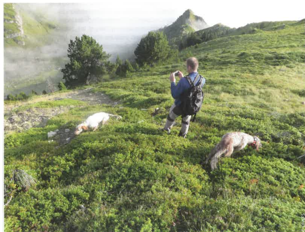
▲ Opération de comptage de perdrix grises des Pyrénées au chien d'arrêt.

Dans les départements où le binôme Agrifaune a travaillé ensemble, des habitudes d'échanges se sont progressivement installées (encadré 3). Chacun a certes déployé ses outils d'expertise, mais la mise en commun des résultats a permis de changer les visions d'un même territoire, voire de créer une vision commune.