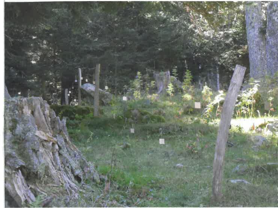
▲ Clôture pastorale équipée de visualisateurs pour prévenir les collisions avec les galliformes.

Les projets de coopération européenne alpins et pyrénéens recensés lors des enquêtes ont essentiellement été orientés sur la connaissance et la conservation des galliformes de montagne et de leurs habitats. Il s'agissait notamment de partager des méthodes et des outils de diagnostic et de suivi. Le réseau des acteurs pastoraux transfrontaliers n'est de fait pas assez connu aujourd'hui pour pouvoir envisager de construire rapidement des projets communs.