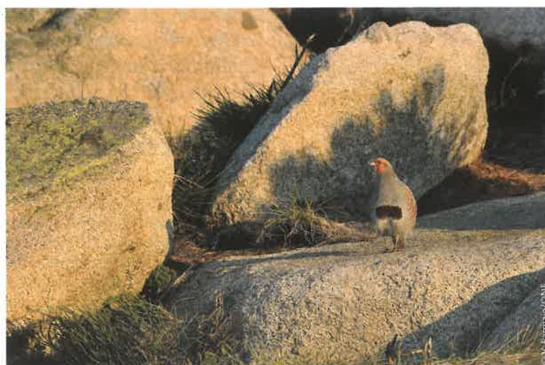
▲ Perdrix grise des Pyrénées.

Le tétras-lyre ( Tetrao tetrix ) fréquente des milieux de transition entre forêts et milieux ouverts où s'imbriquent en mosaïque pelouses, landes et boisements clairs, alors que la perdrix bartavelle ( Alectoris graeca saxatilis ) affectionne les pelouses alpines, landes et boisement clairs entrecoupés de zones rocheuses sur des versants bien exposés. La perdrix grise des Pyrénées ( Perdix perdix hispaniensis ) utilise des landes à ligneux bas à feuillage persistant ou caduque et des pelouses à hautes herbes. Le grand tétras ( Tetrao urogallus aquitanicus ) a la particularité, dans les Pyrénées, d'occuper pour l'élevage des jeunes les milieux ouverts de l'étage subalpin. Le lagopède alpin ( Lagopus muta ) peuple quant à lui les parties basses des landes à éricacées mêlées d'arbres dispersés et les parties hautes des landines, pelouses et arbrisseaux rabougris.