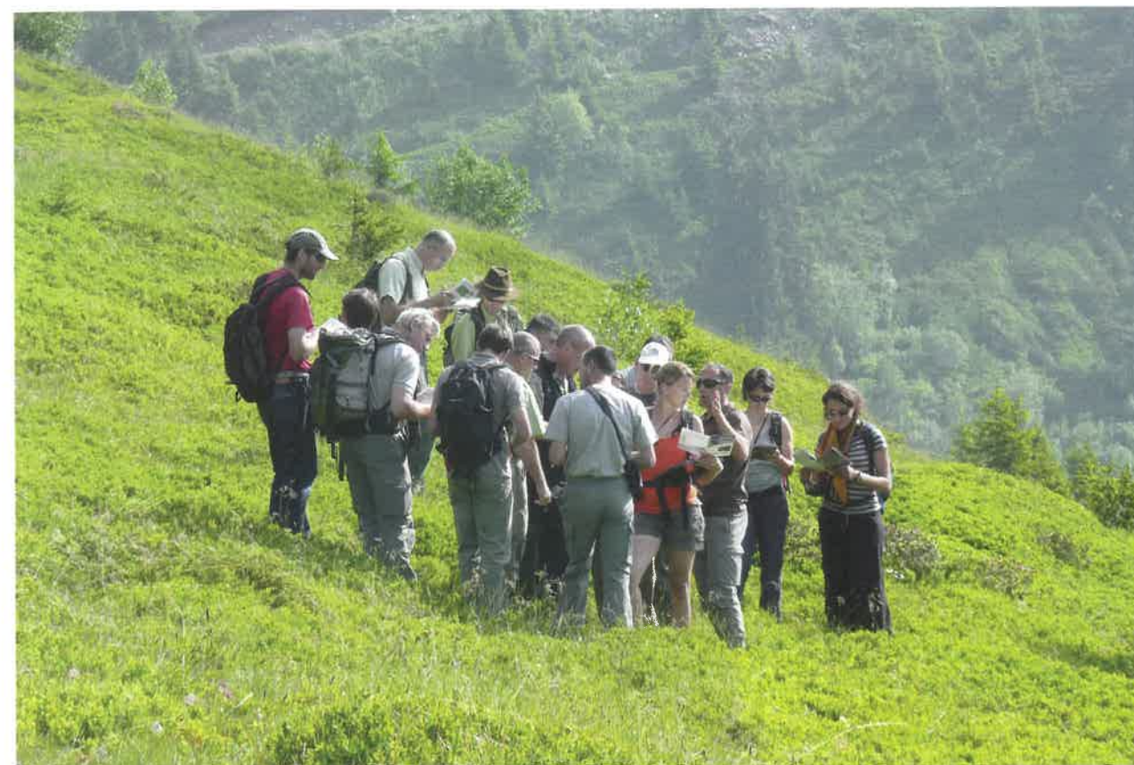
▲ Formation au protocole de diagnostic tétras-lyre.

En 2012, le programme Agrifaune des Pyrénées-Atlantiques a déployé sur trois sites Natura 2000 de la vallée d'Aspe des opérations de réouverture mécanique. L'objectif était de comparer cette technique d'entretien avec l'écobuage pratiqué par les bergers, en termes d'impact sur la conservation de l'habitat de la perdrix grise des Pyrénées, et sur la valeur fourragère des estives (Bibal et al. , 2016). Plusieurs types de suivis ont été expérimentés, afin de comparer l'attractivité des secteurs avant et après travaux pour la perdrix grise en matière d'alimentation. Un suivi de la végétation par la méthode des points-contacts, couplé à des comptages de perdrix grises au printemps et à l'automne, a été conduit sur plusieurs années. En 2014, une expérience Agrifaune similaire a été engagée sur l'alpage d'Aulon dans les Hautes-Pyrénées. La FDC a mesuré l'efficacité d'un chantier de réouverture sur la perdrix grise, et plus largement sur la biodiversité, en mobilisant la boîte à outils « suivi écologique » de la Fédération régionale des chasseurs (FRC) d'Occitanie. Elle procède, depuis plusieurs années, à des relevés de végétation, d'orthoptères